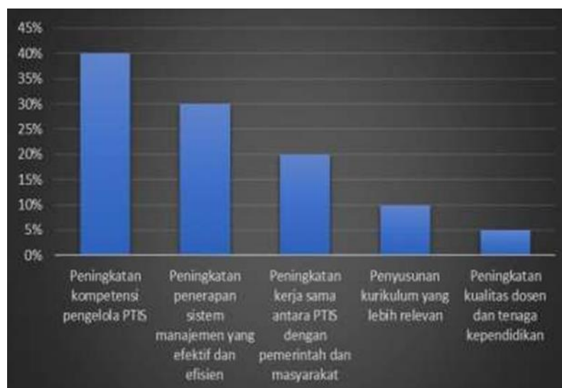
Gambar 2. Solusi Pendidikan di Perguruan Tinggi Islam Swasta

Berdasarkan data diagram statistik di atas, dapat dilihat bahwa solusi utama pendidikan di Perguruan Tinggi Islam Swasta (PTIS) adalah peningkatan kompetensi pengelola PTIS. Hal ini dapat dilihat dari persentasenya yang mencapai 40%.